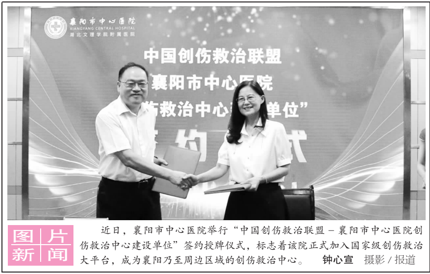
近日,襄陽市中心醫院舉行“中國創傷救治聯盟—襄陽市中心醫院創傷救治中心建設單位”簽約授牌儀式,標誌著該院正式加入國家級創傷救治大平台,成為襄陽乃至周邊區域的創傷救治中心。